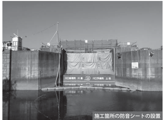
施工箇所の防音シートの設置