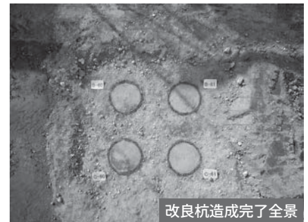
改良杭造成完了全景

また、この仕事は様々な土地に行き、そこで様々な人と出会い、長い月日を重ね、ひとつの物を造り上げていきます。たくさんの方が手を取り合い、協力し合うからこそ造り上げ、それが完成した時の喜びや達成感は格別なものです。