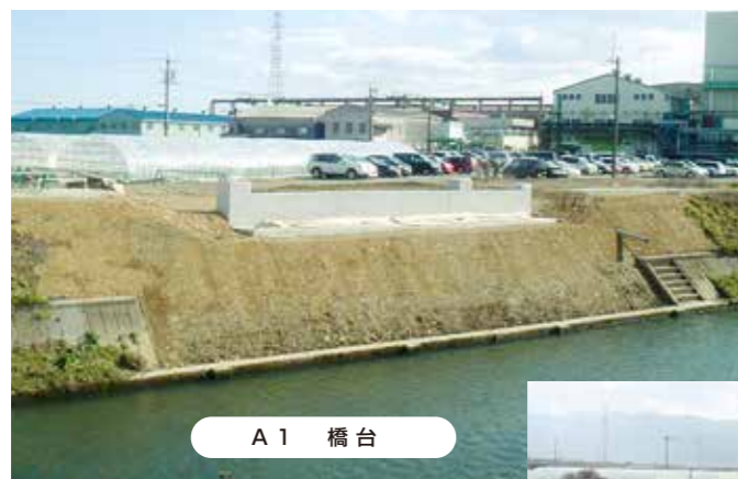
A 1 橋台