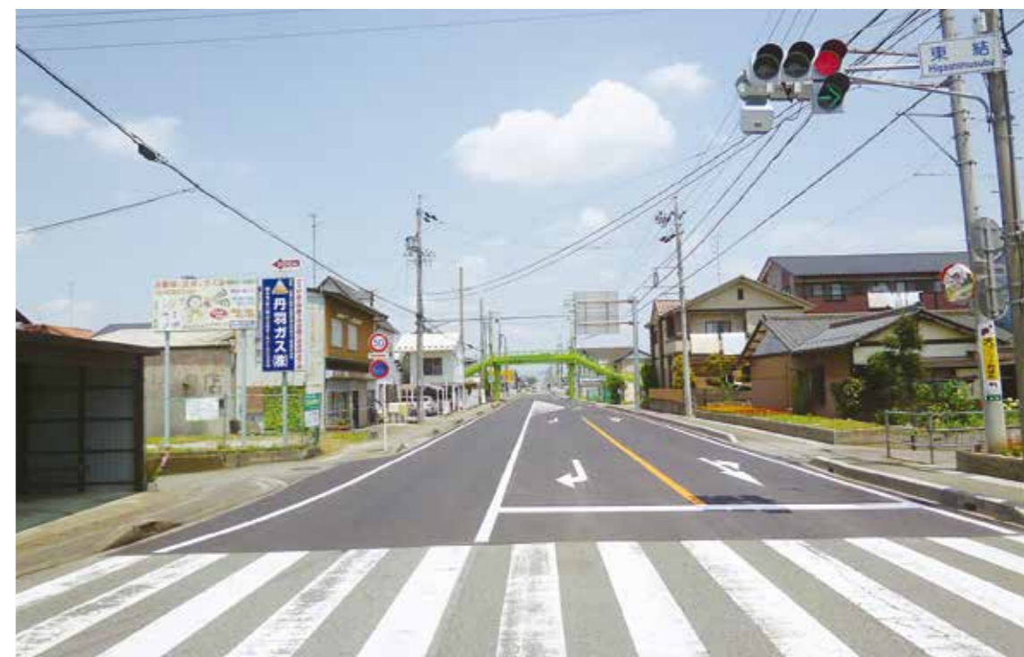
平成24年度 大垣土木事務所発注 県単 舗装道補修工事