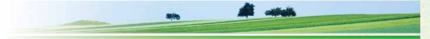
平成21年度 瑞穂市発注 都開工第29号 野白新田都市下水路（第3期）工事