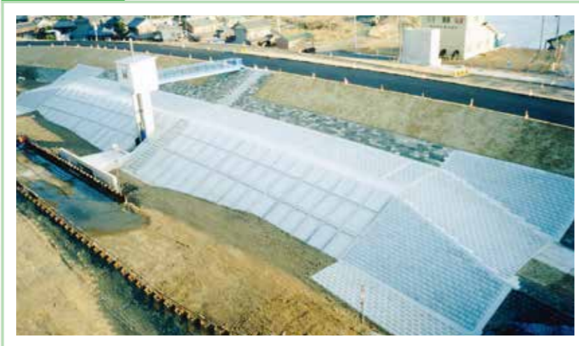
平成9年度 揖斐川帆引新田 排水ひ管工事〈不動建設〉