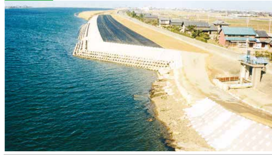
平成11年度 木曾川加路戸高潮堤補強工事