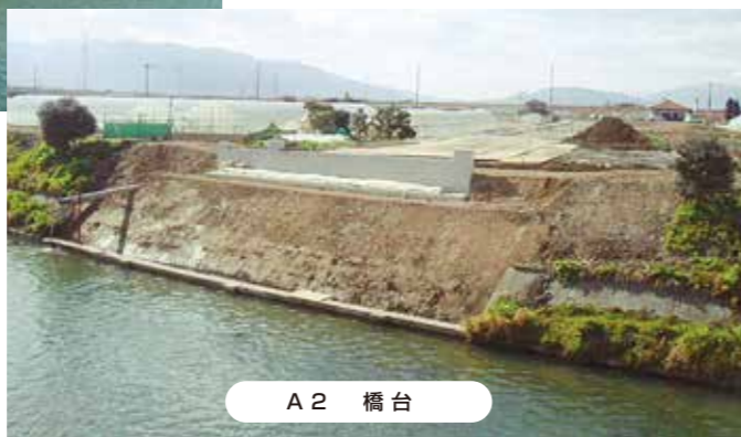
A 2 橋台