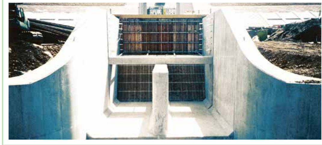
平成5年度 農水省発注 長良川用水地区中江 揚水機場取水口工事<アイサワ工業>