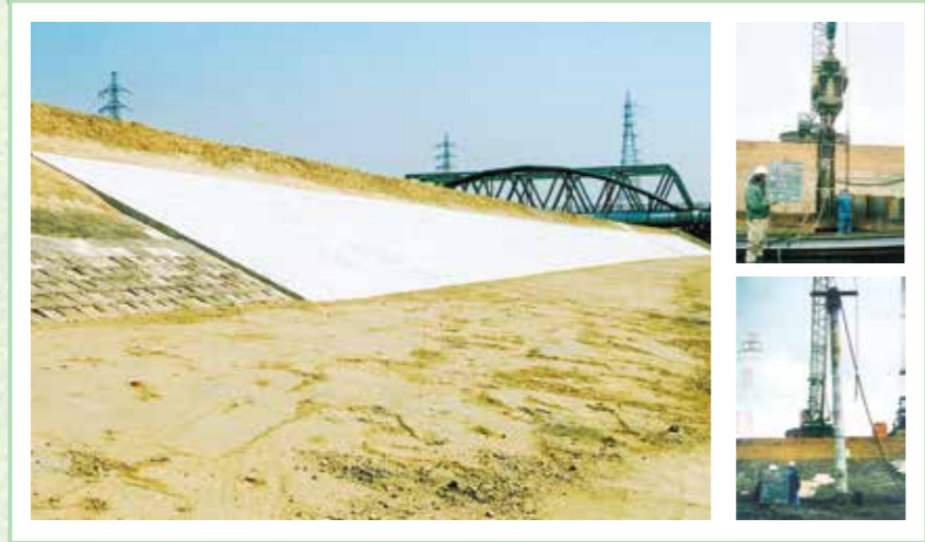
平成10年度 建設省発注 木曾川五明護岸工事〈土屋組〉