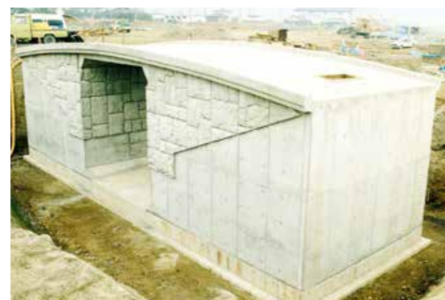
建設省発注 木曾三川公園アクアワールド水郷園路及び護岸工事