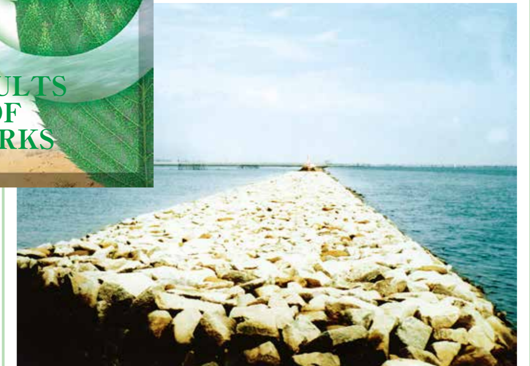
昭和62年度 建設省発注 津屋川羽沢築堤工事（地盤改良、プレロードを含む）