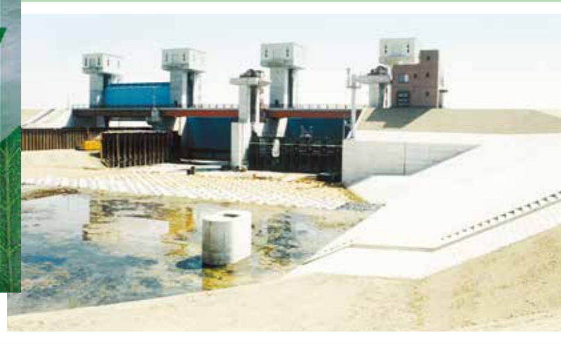
1期工事 (昭和61年度~62年度) 建設省発注 津屋川水門改築工事 2期工事 (昭和63年度~平成元年度) <フジタ・大日本土木JV>