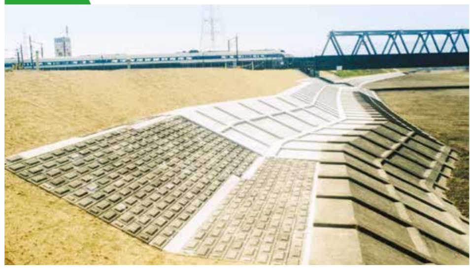
平成12年度 揖斐川平町護岸工事