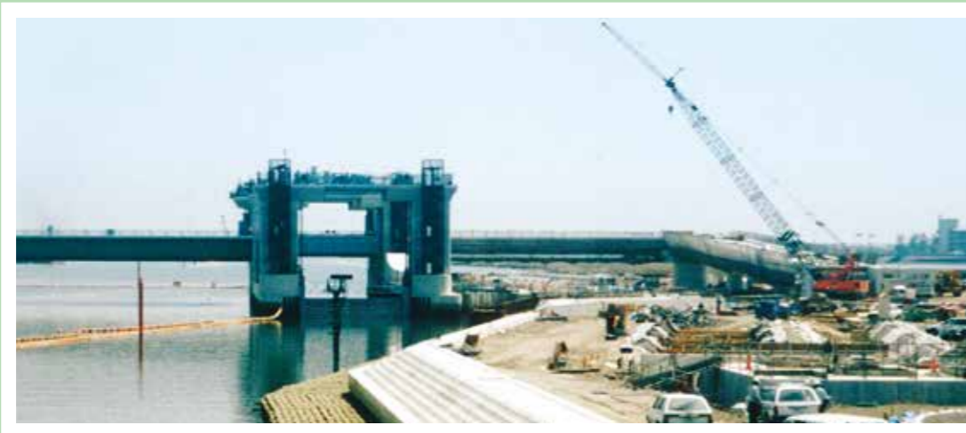
平成5年度 水資源開発公団発注 長良川河口堰建設第5期工事<大成建設・鹿島建設・五洋建設JV>