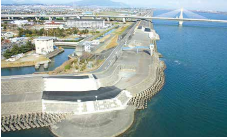
平成21年度 “木曾川松蔭高潮堤防工事”