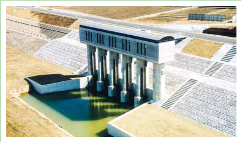
平成7年度 建設省発注 木曾川 日光川排水樋門工事〈東急建設〉