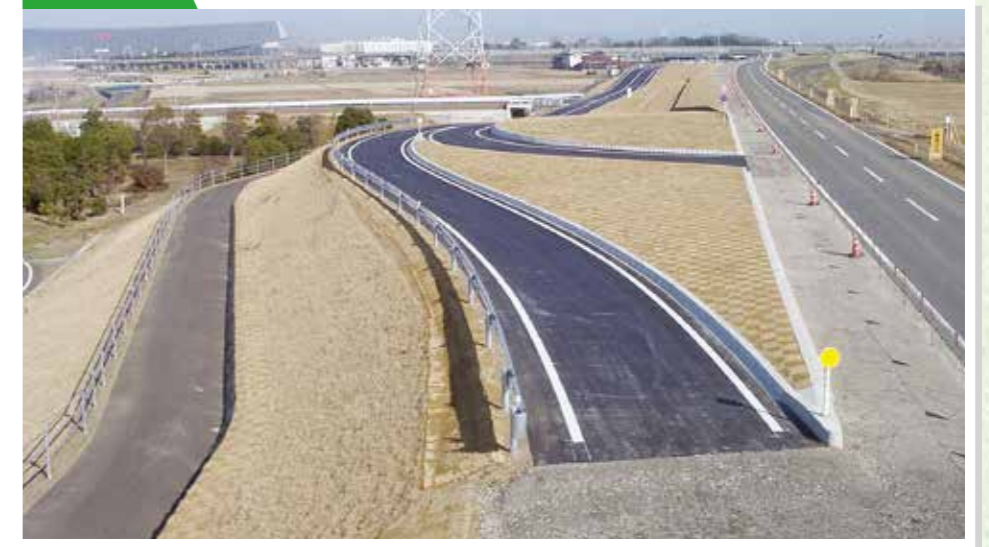
平成14年度 “県営ふるさと農道整備事業大森地区第9期工事”