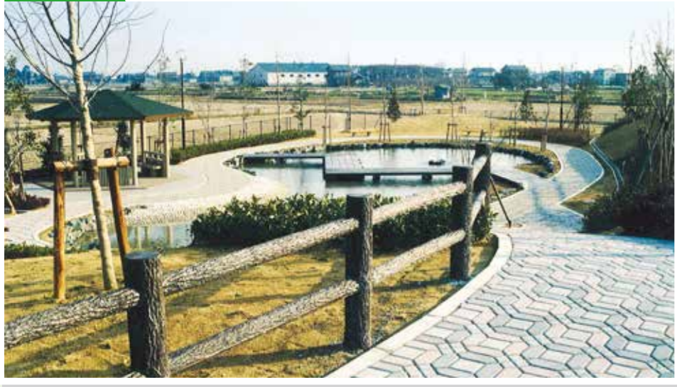
平成6年度 安八町 “歴史の道 修景整備事業公園工事”