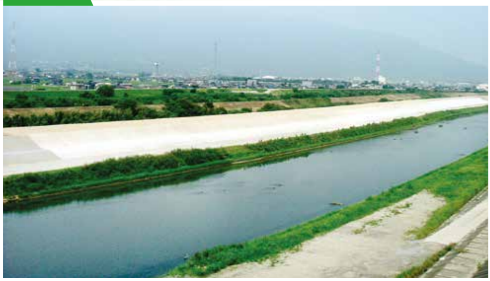
平成18年度 “杭瀬川浅西築堤工事”