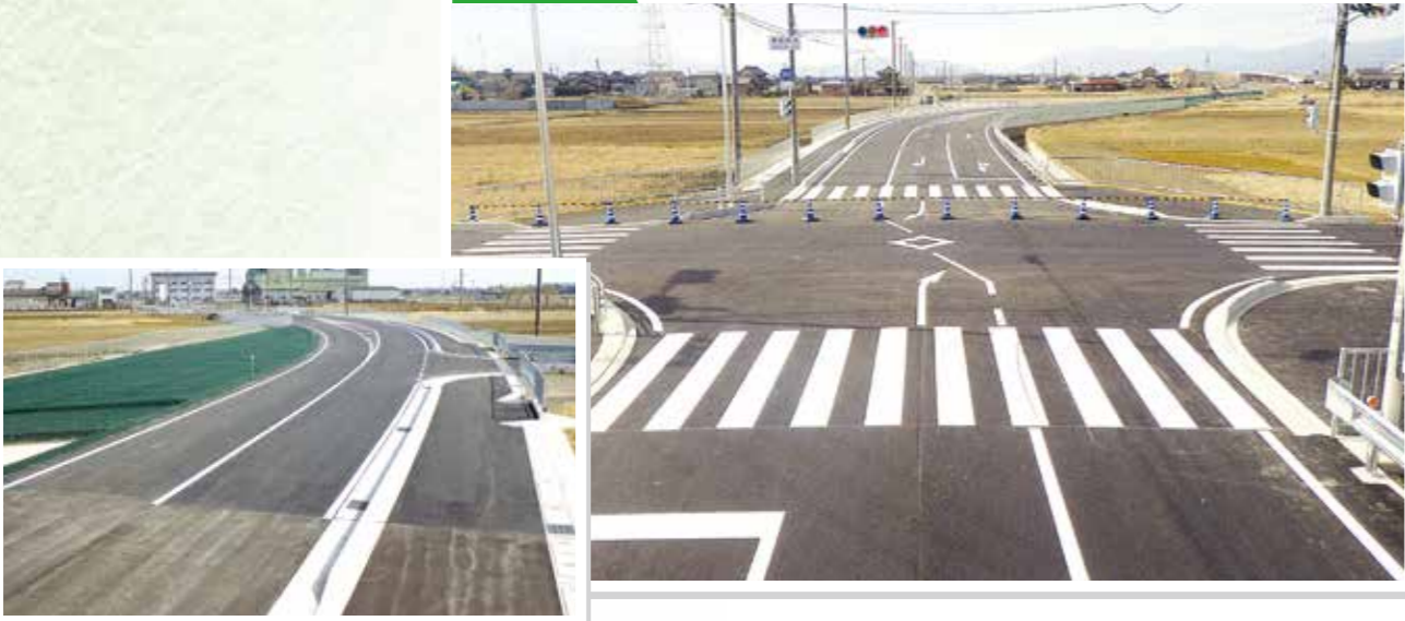
平成27年度 公共 社会資本整備総合交付金(改築)工事