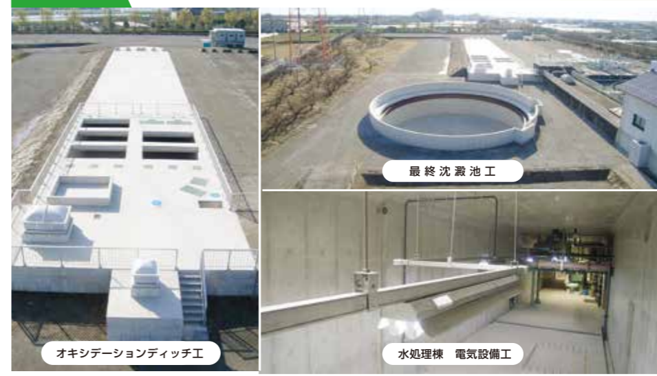
オキシレーションディッチ工