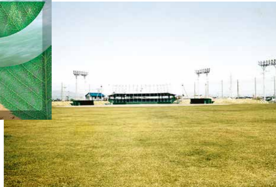
平成元年度 安八町発注 安八町総合運動公園サッカー場新設工事