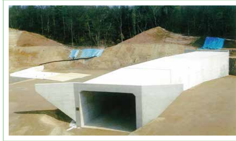
平成12年度 国土交通省発注 東海環状瀬戸東I.C.地区道路改良工事<クボタ建設>