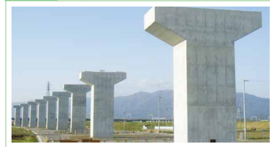
平成19年度 国土交通省発注 東海環状綾野北高架橋工事<鈴木工業>