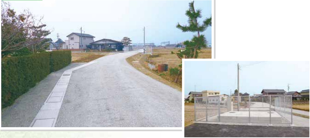
平成26年度 県営かんがい排水事業損斐川以東（第二期）地区 第8号水路工事