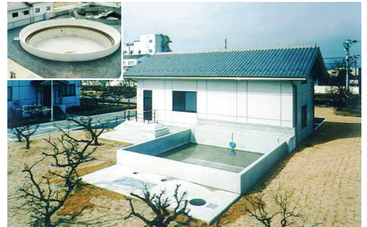
平成18年度 日本下水道事業団発注 安八町安八浄化センター建設工事その7<高田・堀JV>