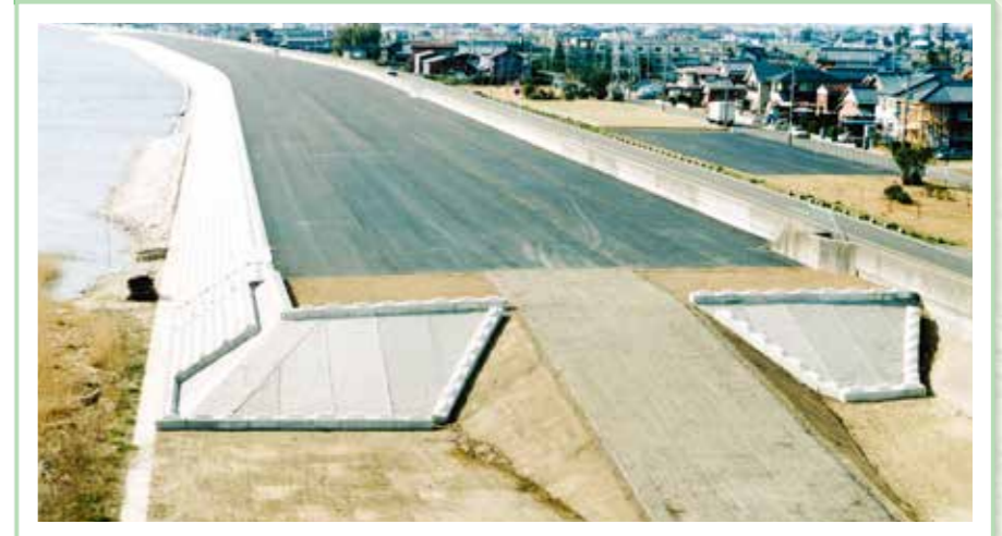
平成7年度 建設省発注 木曾川松ヶ島高潮堤補強工事<矢作建設工業>