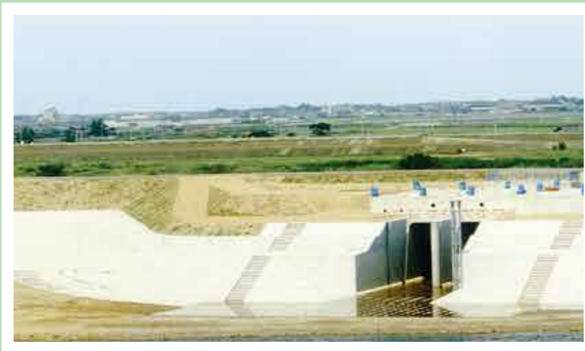
昭和63年度 建設省発注 津屋川排水機新設工事<住友建設>